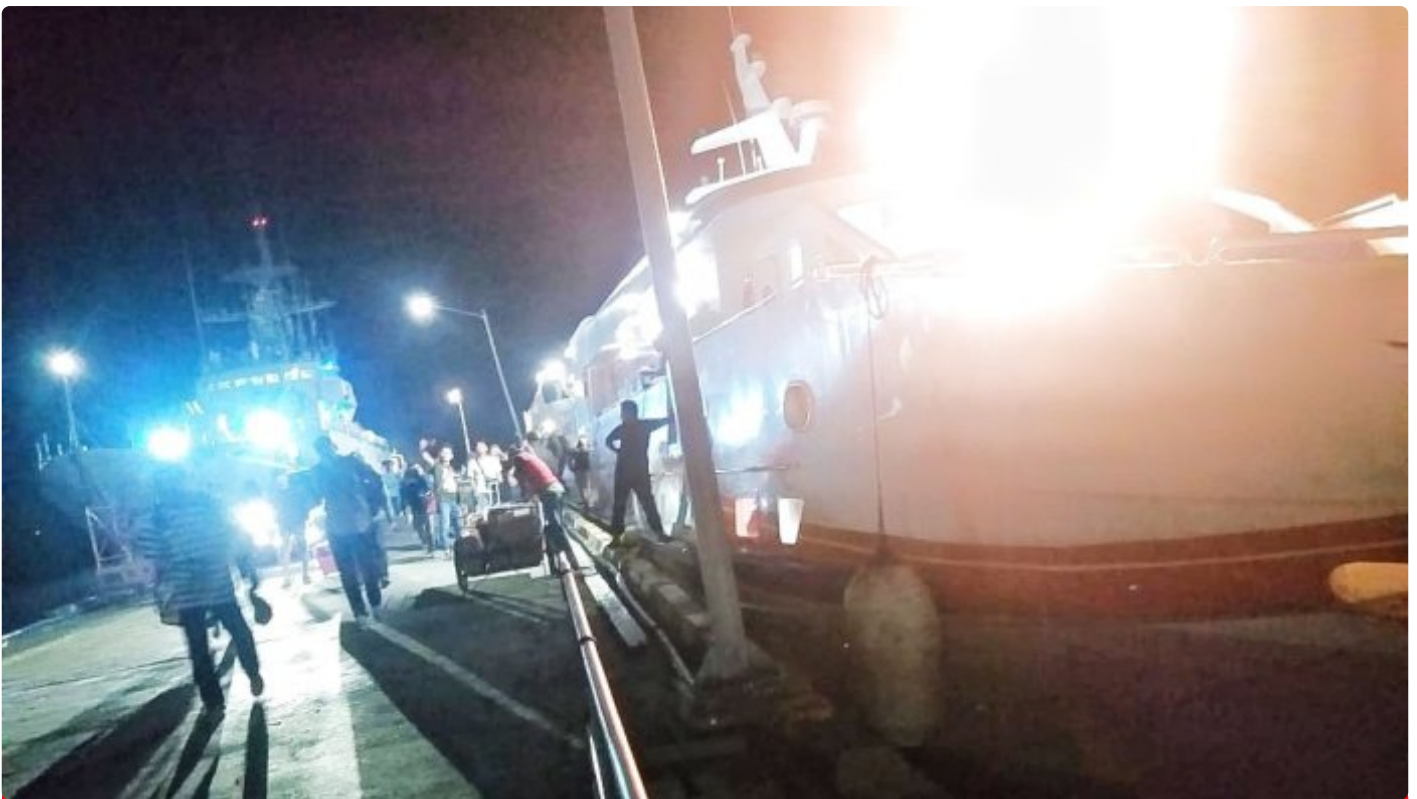
Pihak Penyidik Polda Sultra Dari Kendari Tiba Di pelabuhan Murhum Baubau. Rabu (23/08)

BAUBAU - Informasi beredar jika Pihak Polda tiba diBaubau malam ini, Rabu (23/08)