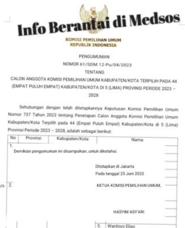
Gambar Pengumuman KPU RI Secara Resmi dan Yang Tersebar Luas di Media WhatsApp

BAUBAU - Beredar Pengumuman Calon Komisiner KPU pada 44 Kabupaten/Kota di 5 Propinsi yakni Sulawesi Utara, Sulawesi Selatan, Sulawesi Barat, Sulawesi Tenggara, dan Kepulauan Riau di Sinyalir menjadi berita bohong atau HOAX.